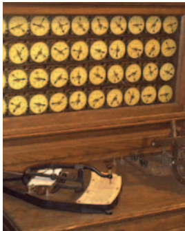
Εικόνα 1.2. Η μηχανή του Χόλλεριθ

Πληροφορίες που έχουν προκύψει ως αποτέλεσμα μιας επεξεργασίας, μπορούν να χρησιμοποιηθούν οι ίδιες ή σε συνδυασμό με άλλα δεδομένα για την παραγωγή νέων πληροφοριών. Η διαδικασία αυτή, δηλαδή πληροφορίες να αποτελούν στη συνέχεια δεδομένα σε μία νέα επεξεργασία, χαρακτηρίζεται ως Κύκλος Επεξεργασίας των Δεδομένων (Εικόνα 1.1). Στο παράδειγμα της σχολικής εκδρομής μπορούμε να χρησιμοποιήσουμε την πληροφορία για το τελικό κόστος ανά μαθητή σε συνδυασμό με τα χρήματα του κουμπαρά μας (δεδομένο), ώστε να μάθουμε αν διαθέτουμε αρκετά χρήματα, για να πάμε τελικά στην εκδρομή.