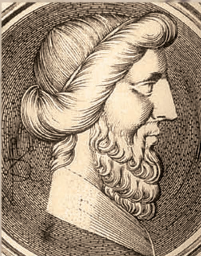
ΑΡΧΥΤΑΣ Ο ΤΑΡΑΝΤΙΝΟΣ (428 - 365 π.Χ.)