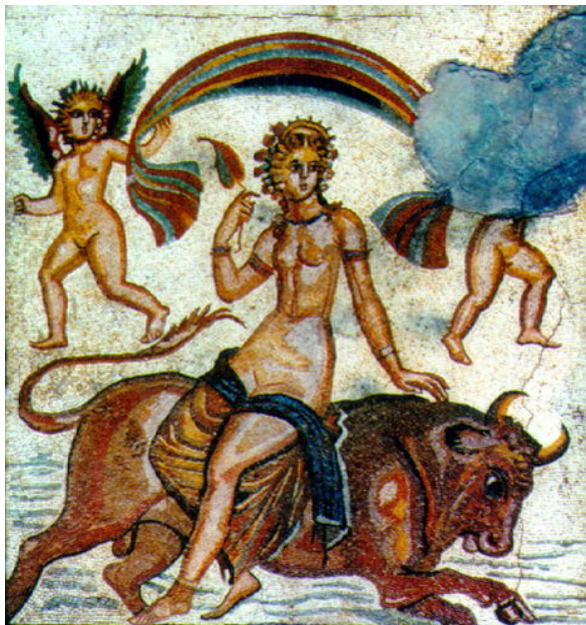
Mosaic floor of a Roman villa, early 4th century, Sparta Museum

Σύμφωνα με το μύθο η Ευρώπη ήταν μια όμορφη πριγκίπισσα που γεννήθηκε κάπου στον σημερινό Λίβανο. Τα ιδιαίτερα όμορφα και πλατιά της μάτια, από τα οποία και βγήκε το όνομά της («ευ-ώπη») τράβηξαν την προσοχή του Δία του βασιλέα των θεών. Αμέσως μεταμορφώθηκε σε άσπρο ταύρο και απήγαγε την όμορφη Ευρώπη ενώ αυτή έπαιζε με τις φίλες της στην παραλία. Μεταφέροντας το πολύτιμο φορτίο του ο ταύρος διέσχισε κολυμπώντας την Ανατολική Μεσόγειο και έφερε την Ευρώπη στην Κρήτη όπου το ζευγάρι απέκτησε τρία παιδιά, τον Μίνωα, τον Σαρπηδόνα και τον Ραδάμανθυ. Τα παιδιά μεγάλωσαν και έγιναν βασιλιάδες και δικαστές και κυβέρνησαν την Κρήτη – ο δικαστής Μίνωας έδωσε το όνομά του στον Μινωικό πολιτισμό ενώ η ήπειρος στην οποία ανήκει η Κρήτη ονομάστηκε Ευρώπη.