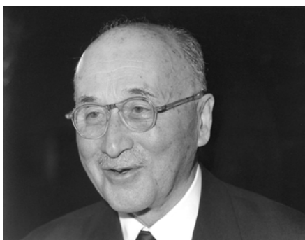
Τίποτα δεν είναι δυνατό χωρίς τους ανθρώπους, τίποτα δεν διαρκεί χωρίς θεσμικά όργανα, Ζαν Μονέ στα Απομνημονεύματα

ελεύθερου εμπορίου τουλάχιστον στην βόρεια Ευρώπη. Πολλοί θεωρούν επίσης τις συνθήκες ειρήνης της Βεσφαλίας (1648) και των Πυρηναίων (1659), με τις οποίες έληξε ο τριακονταετής πόλεμος, ως σημαντικούς σταθμούς στον δύσκολο δρόμο προς την Ευρωπαϊκή ενοποίηση καθώς θέτουν τις βάσεις για την ειρηνική συνύπαρξη καθολικών και προτεσταντών ύστερα από πολύχρονες ενδοευρωπαϊκές σφαγές.