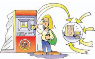
Εικόνα 15.2. Ανάληψη χρημάτων από τα μηχανήματα ATM