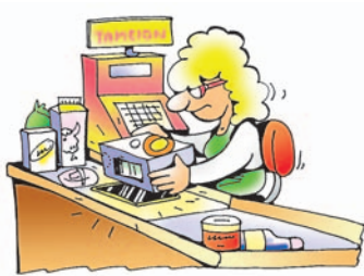
Εικόνα 15.1. Αυτόματη τιμολόγηση προϊόντων

Στις επιστήμες: Οι υπολογιστές επιταχύνουν την επεξεργασία διάφορων ερευνητικών δεδομένων και βελτιώνουν τις μετρήσεις διάφορων οργάνων. Για παράδειγμα, τεράστια τηλεσκόπια έχουν εγκατασταθεί σε αστεροσκοπεία με ενσωμα-