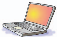
Εικόνα 2.5. Φορητός Προσωπικός Υπολογιστής