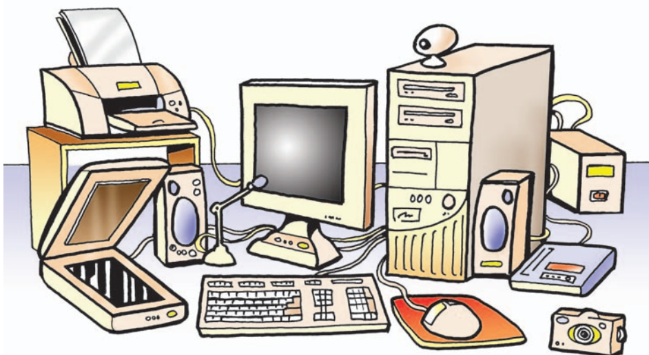
Εικόνα 2.1. Το Υλικό Μέρος ενός υπολογιστικού συστήματος

Ο υπολογιστής, για να λειτουργήσει, χρειάζεται ηλεκτρικό ρεύμα. Γι' αυτό πρέπει να είμαστε προσεκτικοί και να μην επεμβαίνουμε στο εσωτερικό του.