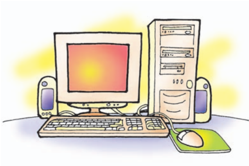
Εικόνα 2.4. Προσωπικός Υπολογιστής

Το μέγεθός τους είναι σχεδόν όσο ένα μεγάλο τετράδιο, ενώ το βάρος τους κυμαίνεται από 1 έως 4 κιλά περίπου. Έχουν δε μπαταρία, ώστε να μπορούν να λειτουργούν ορισμένες ώρες χωρίς να είναι συνδεδεμένοι στο ηλεκτρικό ρεύμα. Παρόλο το μικρό τους μέγεθος, έχουν ανάλογες δυνατότητες με έναν επιτραπέζιο Προσωπικό Υπολογιστή (Εικόνα 2.4).