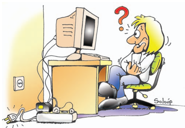
Εικόνα 2.2. Πόσο παρατηρητικοί είσαστε; Βρείτε γιατί δε λειτουργεί ο υπολογιστής της εικόνας.

Όταν μία συσκευή μπορεί να στέλνει και να δέχεται δεδομένα από τον υπολογιστή, τότε χαρακτηρίζεται συσκευή εισόδου-εξόδου . Παράδειγμα συσκευής εισόδου-εξόδου είναι η οθόνη αφής. Οθόνες αφής μπορούμε να συναντήσουμε σε συσκευές αναζήτησης πληροφοριών στα αεροδρόμια ή σε κάποια μηχανήματα αυτόματης συναλλαγής που χρησιμοποιούνται στις Τράπεζες (ATM – Αυτόματη Ταμειολογιστική Μηχανή).