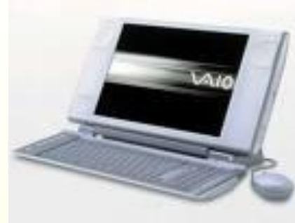
Προσωπικός Υπολογιστής (Laptop)