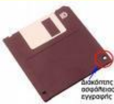
Δισκέτα (Floppy Disk)