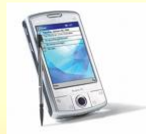
Υπολογιστής Παλάμης (Palmtop)