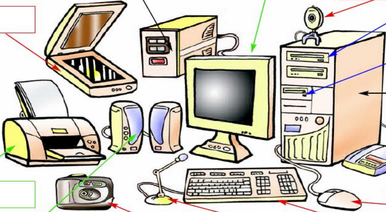
Εικόνα 2.3. Το Υλικό Μέρος ενός υπολογιστικού συστήματος

Μικρόφωνο (microphone): μας βοηθάει να εισαγάγουμε τη φωνή μας ή άλλους ήχους στον υπολογιστή.