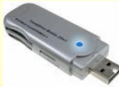
Μνήμη Φλας (Flash Memory)