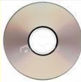
(CD ROM, DVD)