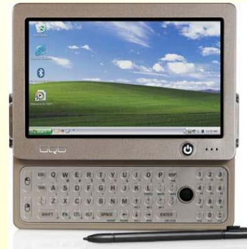
Προσωπικός Υπολογιστής (Notebook)