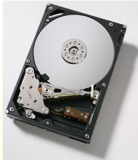
Σκληρός Δίσκος (Hard Disk)