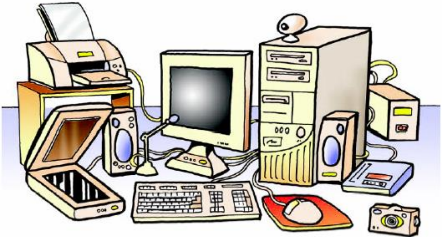
Εικόνα 2.1. Το Υλικό Μέρος ενός υπολογιστικού συστήματος

Υλικό του υπολογιστή: Τα μηχανικά και τα ηλεκτρονικά του μέρη. Ότι δηλαδή μπορούμε να δούμε και να αγγίξουμε