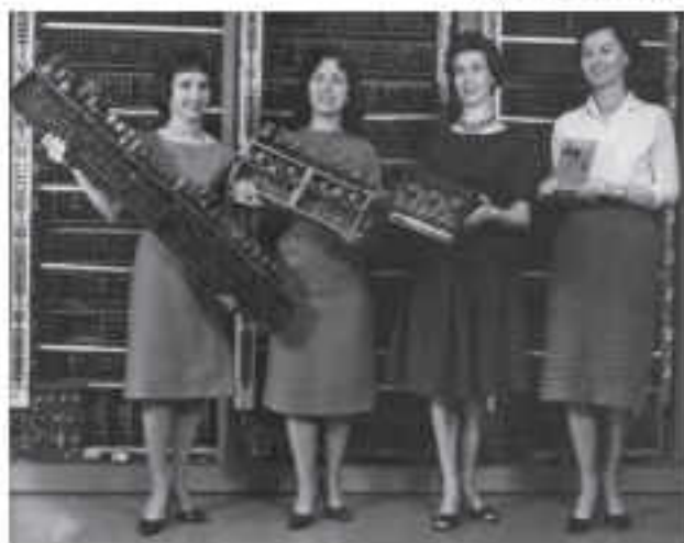
Εικόνα 4.3. Διάφορες πλακέτες υπολογιστών. Μέσα σε δύο δεκαετίες το μέγεθος μακραίνει εντυπωσιακά. (Από τα αριστερά): ENIAC, ED-VAC (ηλεκτρονικές λυχνίες), ORDVAC (τρανζίστορ), BRLESC-I (1962, ολοκληρωμένα κυκλώματα)

Από τις αρχές της ιστορίας της Τεχνολογίας οι εφευρέτες θέλοντας να απαλλάξουν τους ανθρώπους από τους κουραστικούς και μηχανικά επαναλαμβανόμενους υπολογισμούς, κατασκευάζουν υπολογιστικά εργαλεία. Ένας νέος κλάδος της τεχνολογίας της πληροφορίας γεννιέται. Το κύριο βάρος των αριθμητικών πράξεων μεταφέρεται στο εργαλείο, επιτρέποντας την εκτέλεση με μεγαλύτερη αξιοπιστία αριθμητικών πράξεων με πολλούς και μεγάλους αριθμούς. Τα υπολογιστικά εργαλεία τα διαδέχονται στη συνέχεια οι υπολογιστικές μηχανές. Στα μέσα του 20ου αιώνα κατασκευάζεται ο πρώτος ηλεκτρονικός υπολογιστής αλλάζοντας ριζικά τις υπολογιστικές μηχανές (Εικόνα 4.3). Ο ηλεκτρονικός υπολογιστής δεν κάνει απλώς αριθμητικούς υπολογισμούς, όπως οι περισσότερες από τις προγενέστερες μηχανές, αλλά επεξεργάζεται δεδομένα για την παραγωγή χρήσιμων πληροφοριών. Για πρώτη φορά οι άνθρωποι κατασκευάζουν μια μηχανή προσπαθώντας να μιμηθούν τη λειτουργία του εγκεφάλου.