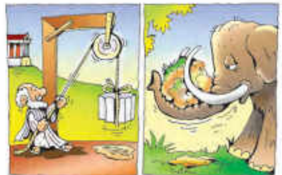
Εικόνα 4.1. Τα εργαλεία και οι μηχανισμοί αντισταθμίζουν τη μικρή φυσική δύναμη του ανθρώπου

Με την οργάνωση πιο σύνθετων κοινωνιών οι άνθρωποι ανακάλυπτουν τη γραφή (περίπου το 3500 π.Χ.), που τους επιτρέπει να καταγράφουν και να διανέμουν ακόμα περισσότερες πληροφορίες. Οι καθημερινές συναλλαγές γεννούν την ανάγκη για υπολογισμούς και οδηγούν στην εμφάνιση των αριθμών-συμβόλων (η εμφάνιση του πρώτου συστήματος αρίθμησης με βάση το 60 χρονολογείται γύρω στο 1800 π.Χ.). Αργότερα, γύρω στο 1500 π.Χ., γεννιέται το αλφάβητο, η πιο μεγάλη, ίσως, επινόηση του ανθρώπου στην ιστορία της τεχνολογίας της πληροφορίας, καθώς με τους κατάλληλους συνδυασμούς από ένα μικρό αριθμό συμβόλων δίνεται η δυνατότητα για καταγραφή ενός τεράστιου πλήθους πληροφοριών και γνώσεων. Καθώς η οργάνωση των κοινωνιών γίνεται όλο και πιο σύνθετη, οι καταγεγραμμένες πληροφορίες οργανώνονται και διαφυλάσσονται σε βιβλιοθήκες.