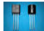
Εικόνα 4.6. Τρανζίστορ