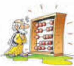
Εικόνα 4.4. Το αβάκιο

Αυτός είναι ο πιο εκτεταμένος κύκλος. Κατά τη διάρκεια της συγκεκριμένης περιόδου εφευρίσκονται αρχικά εργαλεία υπολογισμού, όπως το αριθμητήριο ή αβάκιο (Εικόνα 4.4), ενώ στη συνέχεια δημιουργούνται ολοένα και πιο σύνθετες υπολογιστικές μηχανές που σταδιακά αυτοματοποιούν την εκτέλεση των βασικών αριθμητικών πράξεων.