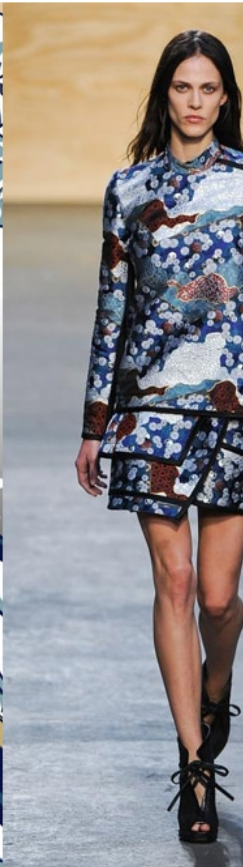
Ιαπωνικές δημιουργίες εμπνευσμένες από Ιάπωνα καλλιτέχνη. Τα χρώματα του αγριεμένου ωκεανού συνυπάρχουν με αρμονικό